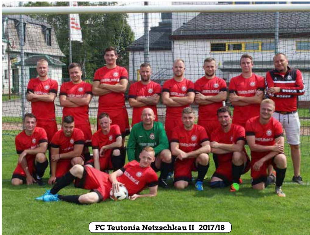
FC Teutonia Netzschkau II 2017/18