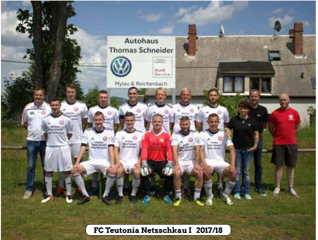
FC Teutonia Netzschkau I 2017/18